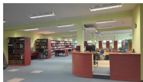
Czytelnia Biblioteki Akademii Pomorskiej