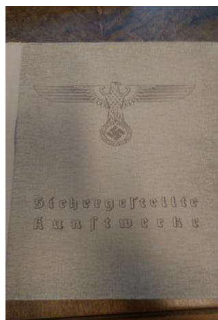
Ciekawostka: Spis cennych zbiorów w Polsce wykonany przez Niemców i wydany w formie broszury, znajduje się w Bibliotece Muzeum Narodowego

Praktykanci zapoznali się również ze szczególnymi działaniami pracowników biblioteki wynikającymi z faktu, że biblioteka jest jednostką Muzeum Narodowego. Odwiedzili działy ściśle współpracujące